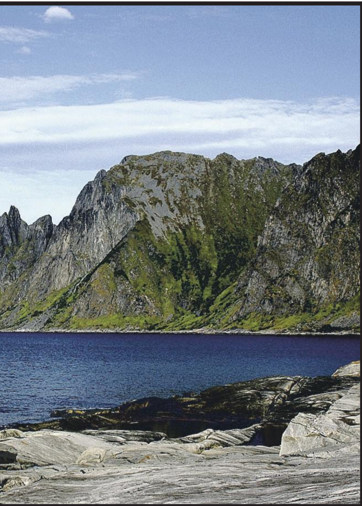
på Senja, skal fortsatt være med på å trekke tilreisende til øya.